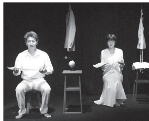
▲安部公房「人間ざつくり」

戯曲や文学作品を俳優の身体を通じて読むというのがリーディングです。本や台本を手にして公演を行います。朗読とも似ていますが、朗読よりも動きがあったり、演出効果もあります。「『読む』という行為」をモチーフにした演劇といえるのかも知れません。（※津あけぼの座ホームページから引用）