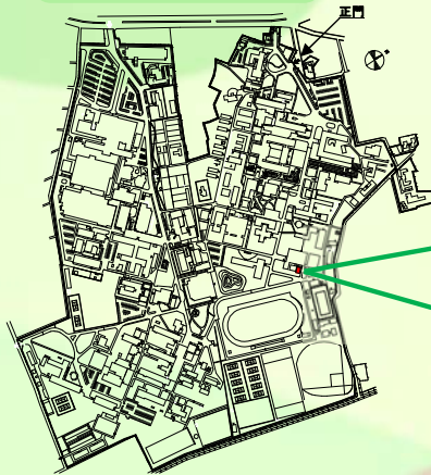
三重大学上浜団地配置図