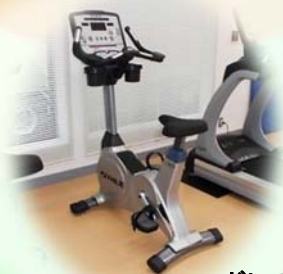
コードレスバイク