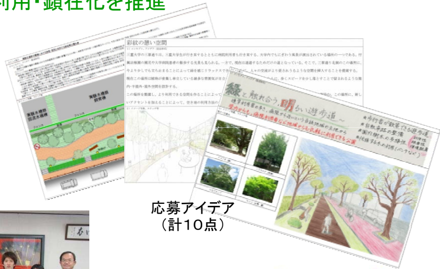
応募アイデア (計10点)