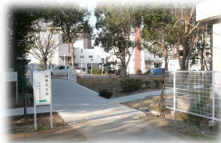
スロープ整備, 見通し確保

工期:平成26年2月7日～平成26年4月15日 金額:26,244,000円 施工:(有)桐生造園