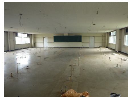
教養教育校舎4号館2階