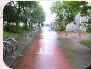
改修前の構内冠水状況写真

H27年度の排水設備工事に合わせキャンパスマスタープラン計画「みどりのモール」が整備された。