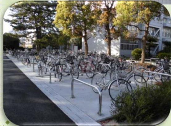
教養教育ゾーンの駐輪場整備・・・約450台