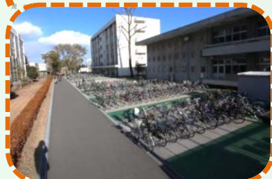
H26 教育学部駐輪場整備・・・約370台