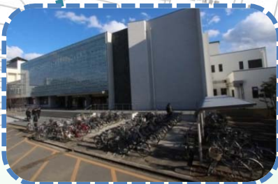
H24 附属図書館の駐輪場整備・・・約50台