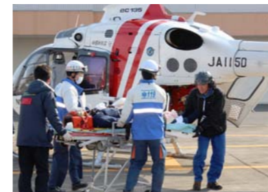
ドクターヘリを用いた救助訓練

2011年2月よりドクターヘリの運航が開始されました。緊急性の高い疾患・外傷に対して医師・看護師がヘリコプターで現場に駆けつける攻めの医療であり、時間との戦いです。心臓や脳の閉塞した血管を一刻も早く開通させるため、重症外傷救命のために運航会社・消防機関との綿密なコラボレーションによって、どこでもだれでもドクターヘリの恩恵にあずかれるような体制ができ、今までの救急体制では助からなかった多くの救命例を経験しています。もちろんドクターヘリは夜間飛ばせませんし、天候によっても運航できないことがありますし、騒音などの問題もありますが、ドクターヘリ体制によって県全体の救急医療連携が深まり、救急医療の質の向上に貢献できています。