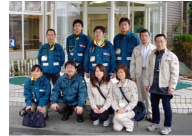
東日本大震災へ赴いた医療救護班

今までは救急医療の充実した研修を目指して三重県から離れてしまう若い医師も少なくありませんでしたが、今後はここ三重県で救急診療の『礎』を築き、多くの病院と連携を取って人事の交流を通してたくさんの仲間たちを集め、多くの若い医師をここで育てていきたいと考えています。