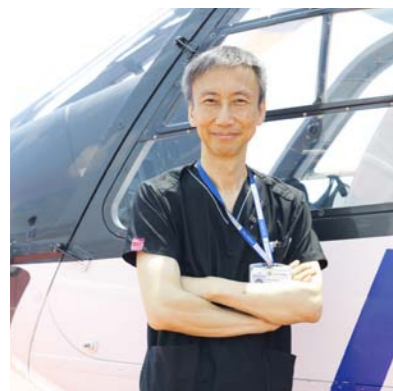
三重大学医学部附属病院教授 救命救急センター長

地域においては消防と連携し、病院前救急体制の確立に向けてメディカルコントロール体制の構築を行っています。また、院内の急変に対応するチーム、呼吸管理サポートチーム、栄養管理チームなども救命救急センター主体で診療科を超えて横断的にチーム