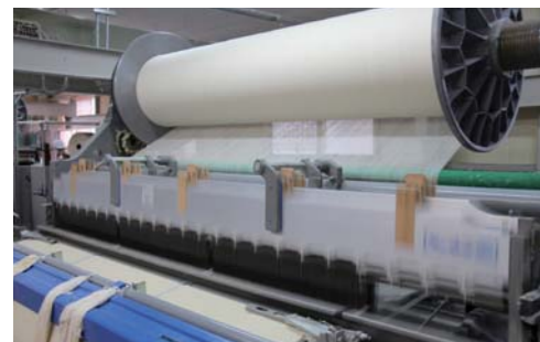
▲経糸と緯糸がものすごい勢いで製織されています

毎日使うタオルに生きる喜びを感じてもらいたい、そんな思いを持ちながら「おぼろの良さ」を生かした製品作りを行なっています。タオルを織る工程から、織上がった生地加工、最終の検品や検針に至るまで、タオル製造一貫作業工程にこだわっています。肌触りを良くするために、通常の半分の太さの糸を使用し、加工に時間をかけ、乾燥でも工夫を凝らし、徹底した手作業での検品検針を行うなど、全ての工程が消費者思いです。一貫生産体制のノウハウを生かした使い勝手の良い製品を、日々消費者へと届けています。