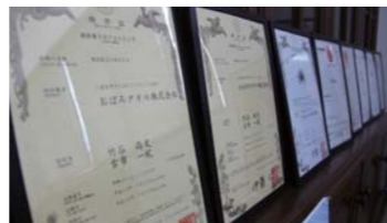
▲これまで取得した特許や受賞した賞が沢山ありました