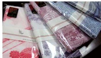
▲伊勢型紙の模様を取り入れた美しいタオルは、伊勢志摩サミットの昼食会で使用されました!