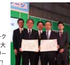
受賞会場(東京ビックサイト エコプロダクツ2015)にて

三重大大学の環境活動が評価され、グリーン購入ネットワーク(GPN)が主催する「第17回グリーン購入大賞」において「大賞」・「環境大臣賞」を受賞しました。「環境大臣賞」はグリーン購入大賞の最上位賞で、大学としては初めての受賞です!