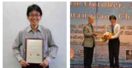
受賞会場(中国 河北省秦皇島市)にて

International Union of Pure and Applied Chemistry & Organization Committee of Novel Materials and their Synthesis (IUPAC & NMS)より、金子教授の「サスティナビリティに資する再生可能水素エネルギー生成のための新規光触媒ナノ材料の創成」の研究が表彰されました。