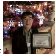
受賞会場(ラスベガス)にて