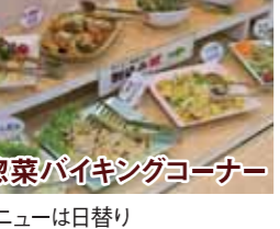
惣菜パイキングコーナー