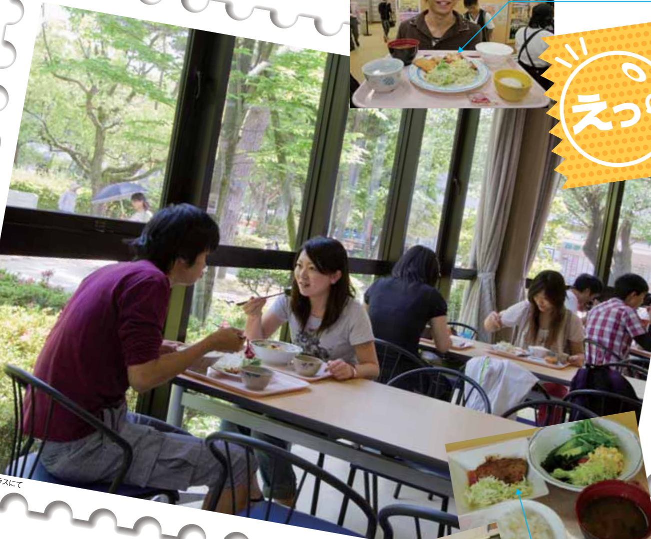
第1食堂 テラスにて