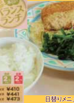
チキン南蛮カツ 目替りメニューです