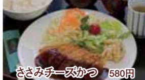
ささみチーズかつ 580円