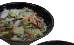
五目野菜うどん 479kcal/350円