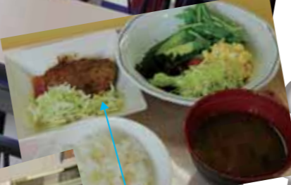
「ハンバーグおろしソース」