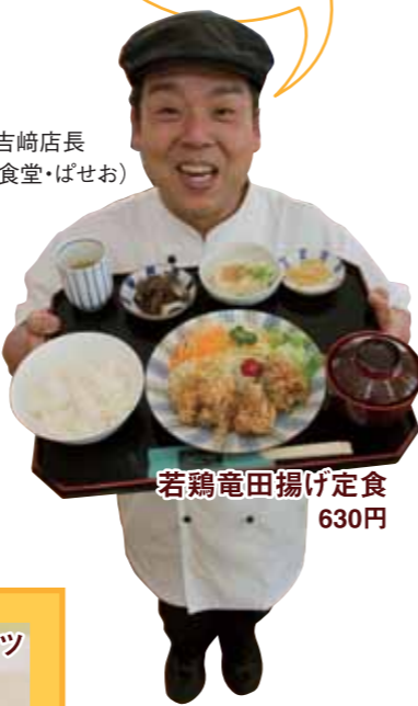
若鶏竜田揚げ定食 630円