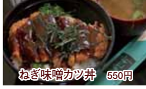
ねぎ味噌カツ丼 550円