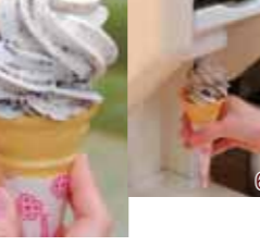
ソフトクリーム 160円 6種類