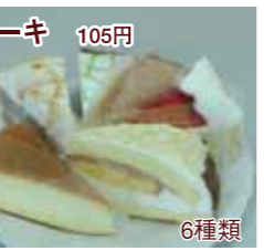
ケーキ 105円 6種類