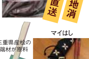
マイはし 三重県産松の端材が原料