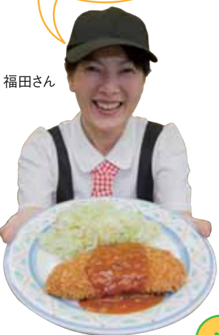
ささみチーズカツ 283円