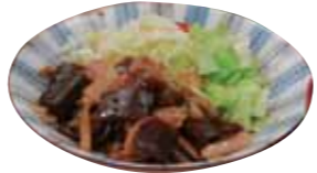
豚肉の生姜焼 (黒にんにやく入) 701kcal/680円

～第1食堂、第2食堂、ばせおの3店舗～ 1日1品を提供、サンプルボードでご確認ください。