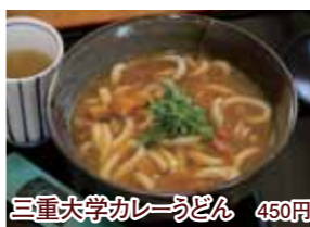
三重大学カレーうどん 450円