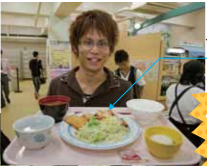
◀バランスランチ 「ハンバーグたっぷり野菜のせ」