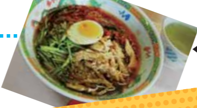
◀初夏メニュー 「冷麺」