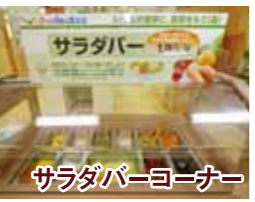
サラダバーヨーナー 1.26円/1g