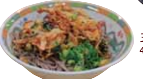
冷やし手作りかきあげそば 565kcal/340円