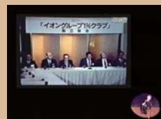
「イオン1%クラブ(現名称)」設立