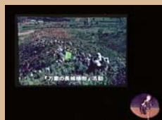
「万里の長城植樹」活動