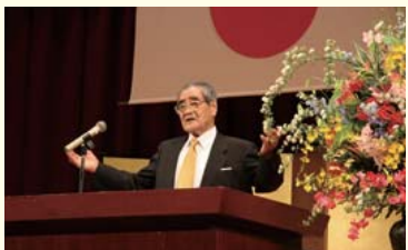
記念講演「企業の社会的責任」