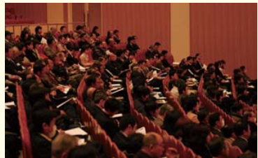
ホールは、一般の人や学生でいっぱい