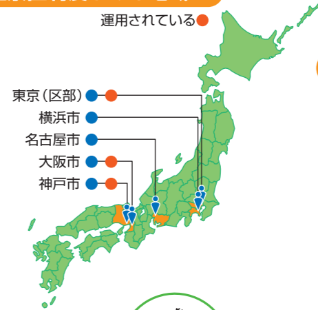
図1 監察医制度がある地域