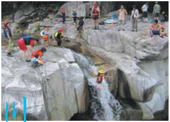
▲天然石のすべり台(銚子川上流・魚飛溪にて)

銚子川のほとりにあるキャンプ場。ここの釣り堀で釣ったアマゴや、町内の白浦地区で養殖した岩ガキなど、新鮮な海の幸のバーベキューが楽しめます。燻製体験で作ったスモークチーズやソーセージの味も最高でした!! 次に来た時は、併設のコテージやキャンプサイトに泊まり、満天の星空を思いっきり楽しもうと心に決めました(^_^)v。