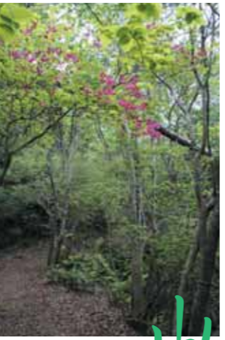
▲荷坂峠のオンツツジ