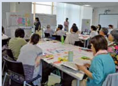
講義・演習の風景（ファシリテーション演習）

みえ防災・減災センターでは、みえ防災コーディネーターやみえ防災塾修了生に登録いただく「みえ防災人材バンク」を設け、防災人材の情報を集約し、市町・企業・地域等からの要請に応じて適切な人材を紹介することで、防災人材の活用を促進しています。