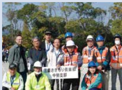
修了生の活動例 防災訓練での啓発活動