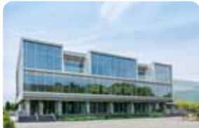
11 環境・情報科学館 世界一の環境先進大学を目指すために、環境に関する取組等を分かりやすく展示し、環境を学べるコーナー等を設けています。