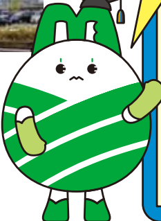
三重大学マスコットキャラクター ミールド