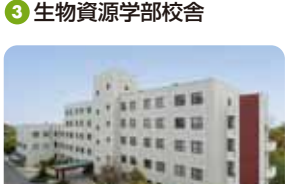
3 生物資源学部校舎