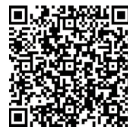
申込フォーム QRコード

QRコードから参加申込フォームにアクセスしていただき、必要事項を入力してください。