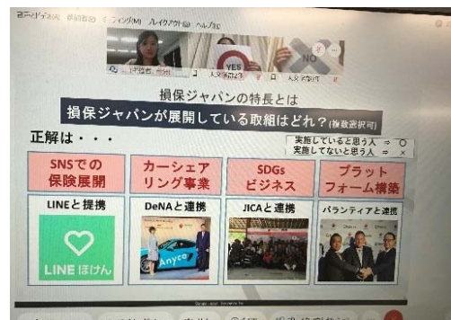
事前の送付したO×カードで意思表示