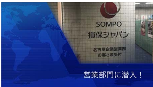
臨場感を意識した現場紹介VTR

3日間のインターンシップを通して、特に「挑戦」という保険の先へ進む姿勢が印象に残っています。今回の経験を活かし、私自身も先に向かって挑戦する姿勢を持ち続けたいと思います。