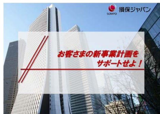
リスクコンサルティング(営業部門)体験ワーク