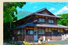
宿泊施設①（予定） 「ライダーハウスいぶき」