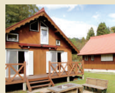
宿泊施設②（予定） 「アグリコテージ」