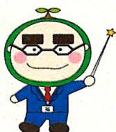
社協マスコット 福ちゃん