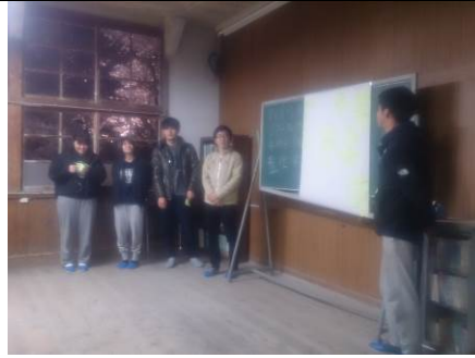
図4：他大学生とのワークショップの様子