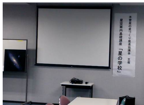
図3：長野県木曽地域での人材育成講座視察の様子 （於 東京大学附属木曽観測所）