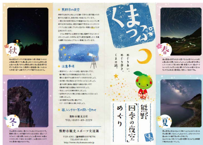
図5：星空をメインにした観光パンフレット(作成中)

これまでの取組みによって、観光協会とは良好な関係が築けた。また、行政に対して星空の観光資源化の取組みについて認知してもらうことができた。1つのおおきな成果として星空観光パンフレットを作成できた(図5)