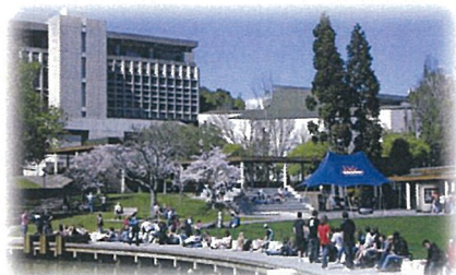
広大な土地に緑あふれるキャンパス