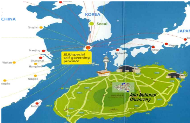
*The Jeju Island map has been magnified for visual purposes.

Jeju was designated as a national Biosphere Conservation area in 2002, a World Natural Heritage in 2007 and achieved World Geological Park Certification in 2010.