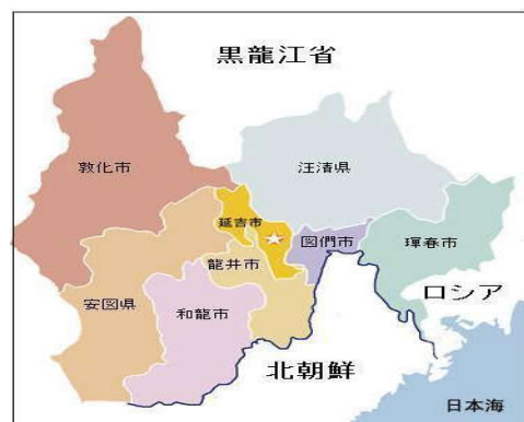
延辺州の行政区分