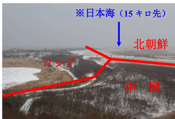
延辺・防川からみた中-ロ-朝国境