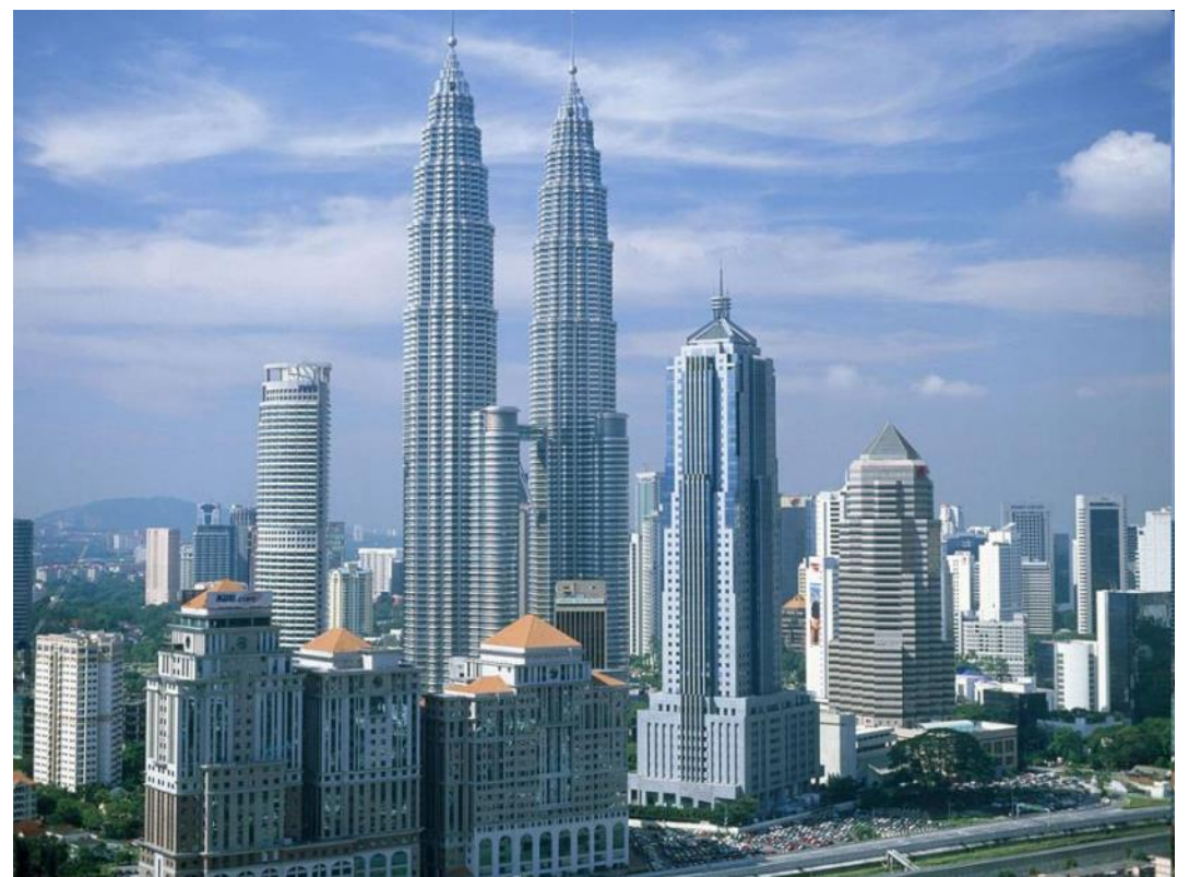
クアラルンプール