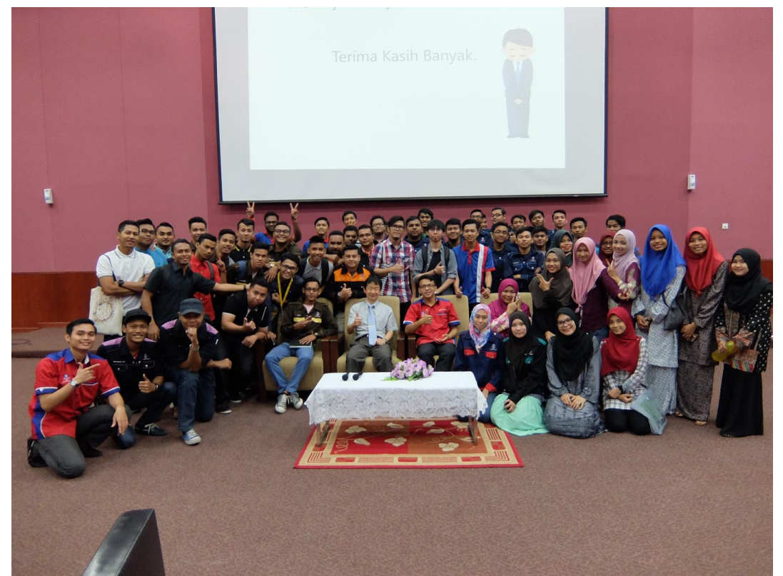
タチ大学の学生と(平成28年)