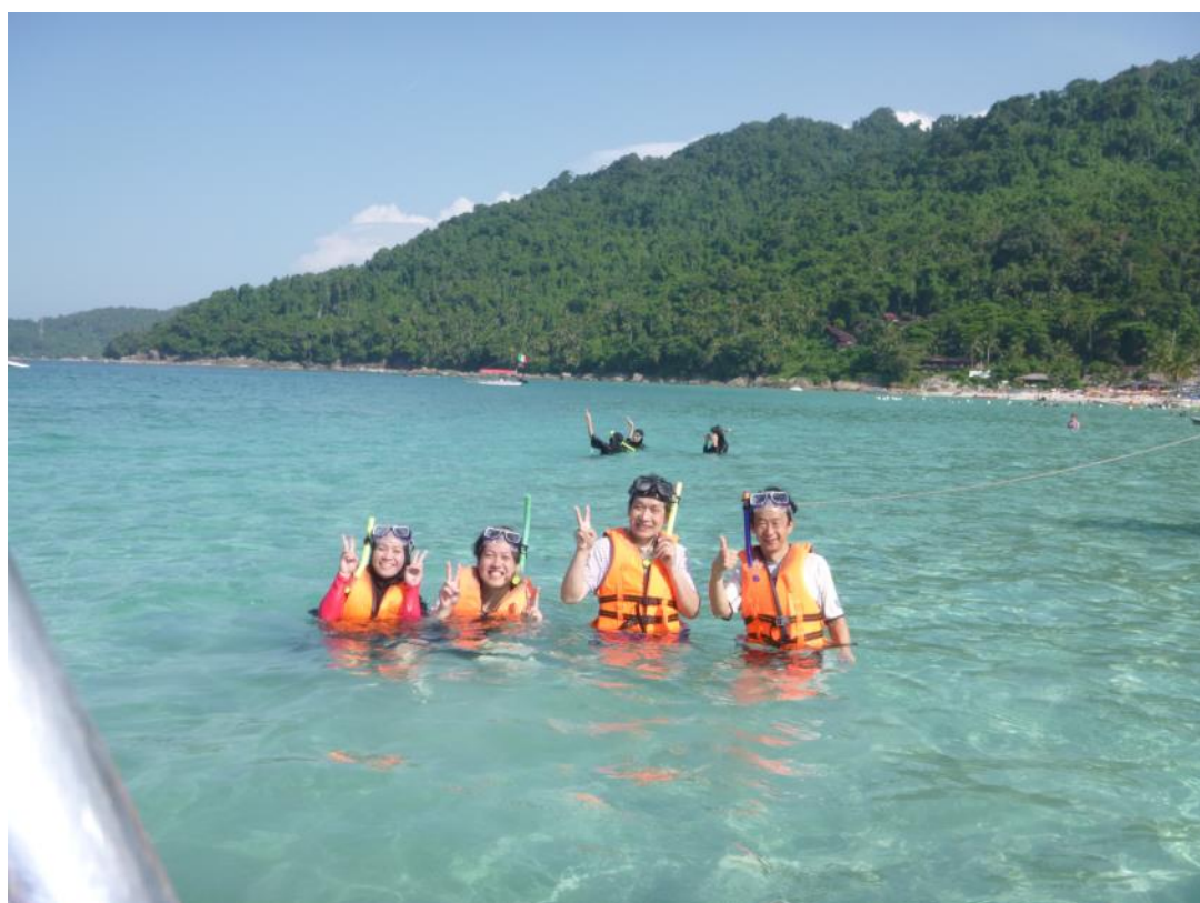
ペルヘンティアン島