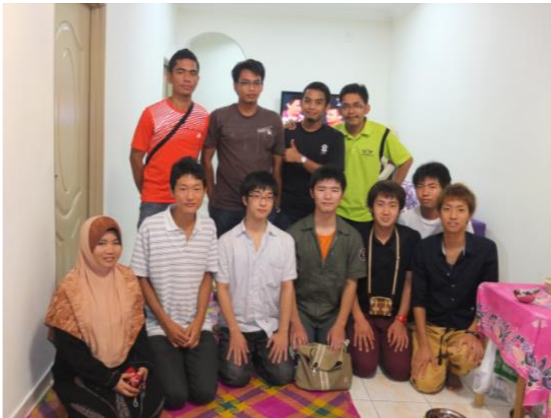
交換留学生(平成25年)