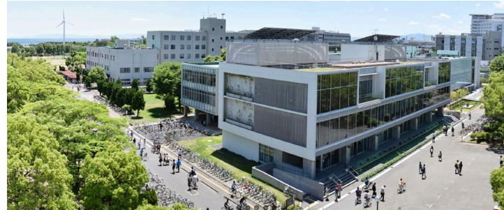
三重大学上浜キャンパス