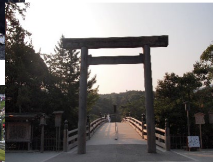
伊勢神宮 内宮 鈴鹿サーキット