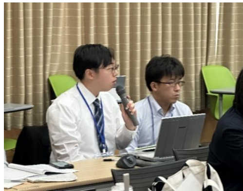
図9 大学院生による発表と質疑の様子