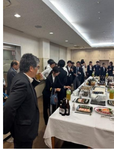
図8 バンケットの様子