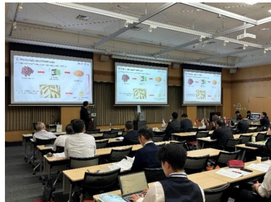
図7 招待講演の様子