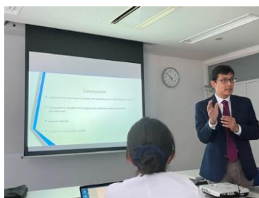
フィリピンの骨・軟部腫瘍の課題についての講義