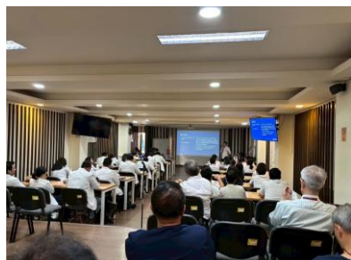
整形外科スタッフ&レジデントと交流