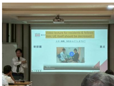
日本における骨・軟部腫瘍の Lecture