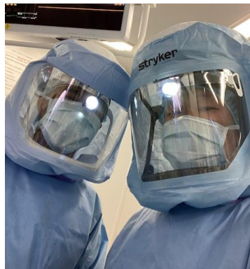
手術見学および骨・軟部腫瘍外来見学