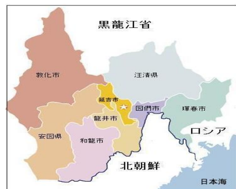
延辺州の行政区分