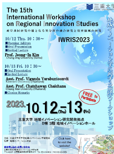
図1 IWRIS2023 国際ワークショップのポスター

地域イノベーション学研究科の発足から毎年行っている「地域イノベーション学に関する国際ワークショップ (International Workshop on Regional Innovation Studies; IWRIS)」は、三重大学内で開催し、海外の大学から研究者を招へいして、教員並びに学生が国際的な情報交流と英語による研究論文の執筆・発表を経験することによるグローバル化に対応した国際感覚を身に付けるための学術交流であり、2023年においても15回目の開催である第15回地域イノベーション学に関する国際ワークショップ (IWRIS2023) (図1) を行った。