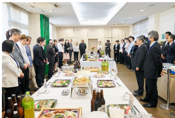
図7 バンケットの様子