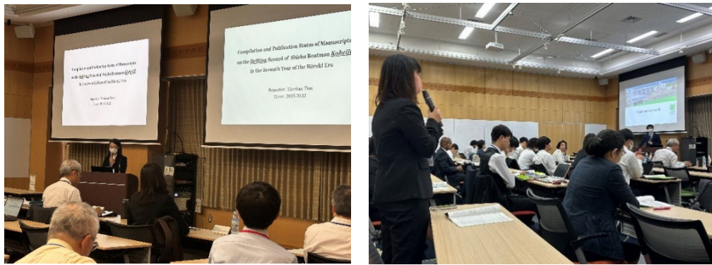
図8 大学院生による発表と質疑の様子