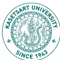
図3 カセサート大学の校章