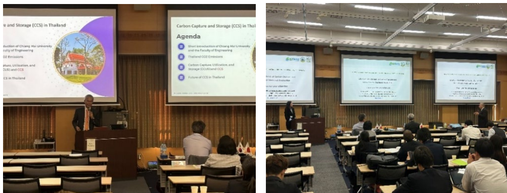
図6 招待講演の様子