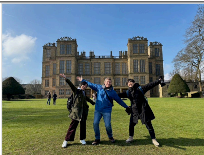
Hardwick Hall (Educational Field Trip)