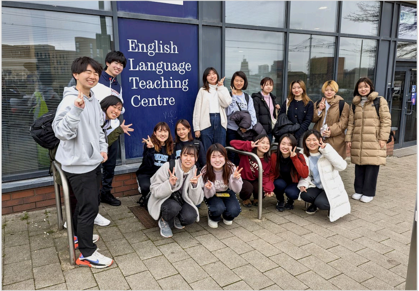
A long tradition: The group photo in front of the ELTC 🙌