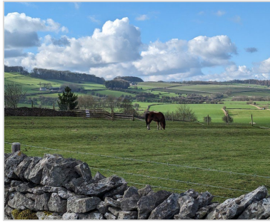
A view of the Peak District