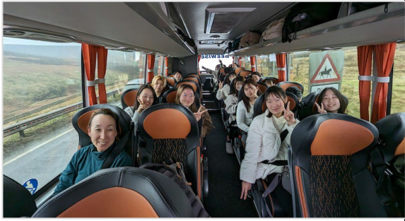
From Manchester Airport to Sheffield