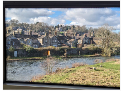
市場町のベイクウェル