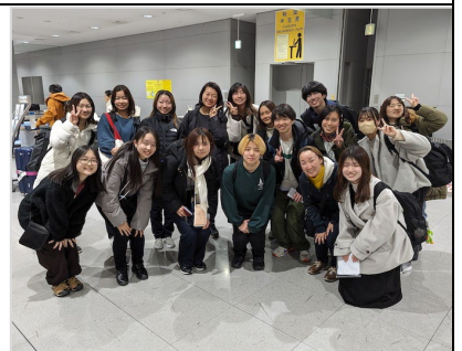
Back in Japan! (Kansai International Airport)