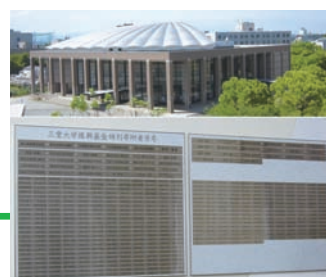
寄附者様銘板設置 (講堂)