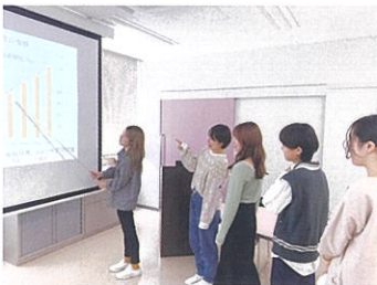
精神看護学を学ぶ

精神の健康に影響を与える要因や精神障害のある対象とその家族についての理解を深め、メンタルヘルスの保持増進・回復に向けた看護の理論・支援方法について学習します。