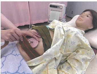
母性看護学を学ぶ

性と生殖の観点から、母性の特徴を身体的・心理社会的側面から理解し、女性のライフサイクル全般における女性とその家族のウェルネスを高めるための理論・看護ケアについて学習します。