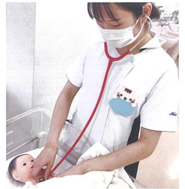
子どもと家族への看護を学ぶ

成長・発達を軸に、一人ひとりの子どもを身体・心理・社会的側面から捉える理論や方法を学び、病気や障害があっても子どもなりの健康が維持・増進される看護について、家族へのケアを含めて学習します。