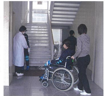
高齢者への看護を学ぶ

対象を全人的に理解し、高齢者のあらゆる健康レベルに応じた健康援助を対象のQOL（生活の質）を向上させる視点と保健・医療・福祉の連携の基に総合的に展開できる基礎的能力を養うことを学習します。