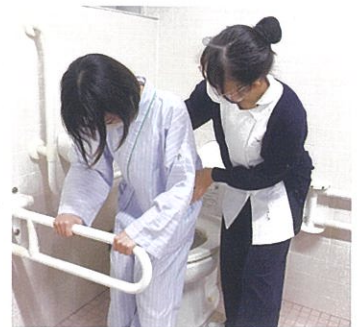
在宅療養者への看護を学ぶ

在宅で療養している様々な年代の人々やその家族を総合的に理解し、その人々が望んでいるその人らしい生活や生き方を支援するために必要な基本的知識・技術・態度を学習します。