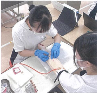
看護の基礎を学ぶ

看護学の概念や理論体系、基礎的看護技術、健康教育について学習します。また、看護の基礎となる人間の心身の機構、人間の環境への適応能力及びそれらへの対処方法についても学習します。