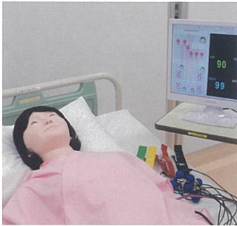
成人の急性期・慢性期の看護を学ぶ

成人期のライフサイクルに沿った身体的・精神的・社会的特性を捉え、急性期、慢性期にある対象と家族への看護行動・技術・理論について学習します。