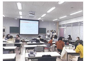
公衆衛生看護学を学ぶ

地域に生活する個人・家族・集団全てを対象とする看護学とその実践を学びます。健康レベルや地域の特性に応じた健康の維持増進、疾病や健康問題の発生予防と回復への支援を行うための理論と方法、保健情報の分析・活用方法を学習します。