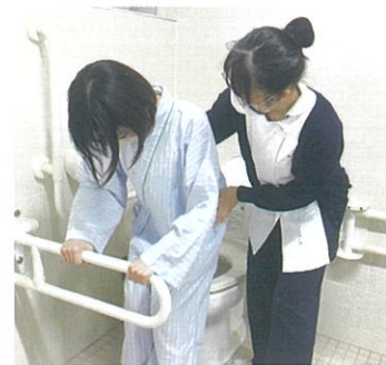
在宅療養者への看護を学ぶ

在宅で療養している様々な年代や疾患の人々やその家族を総合的に理解し、その人々が望んでいるその人らしい生活や生き方を支援するために必要な基本的知識・技術・態度を学習します。