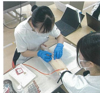
看護の基礎を学ぶ

看護学の概念や理論体系、基礎的看護技術、健康教育について学習します。また、看護の基礎となる人間の心身の機構、人間の環境への適応能力及びそれらへの対処方法についても学習します。