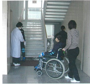
高齢者への看護を学ぶ

高齢者一人ひとりを全人的に理解し、健康な時期から療養・終末期までのあらゆる健康レベルに応じた看護を、QOL(生活の質)の向上を重視し、保健・医療・福祉の連携のもと体系的に学習します。