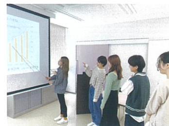
精神看護学を学ぶ

精神の健康に影響を与える要因や精神障害のある対象とその家族についての理解を深め、メンタルヘルスの保持増進・回復に向けた看護の理論・支援方法について学習します。