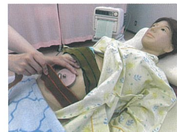
母性看護学を学ぶ

性と生殖の観点から、母性の特徴を身体的・心理社会的側面から理解し、女性のライフサイクル全般における女性とその家族のウェルネスを高めるための理論・看護ケアについて学習します。