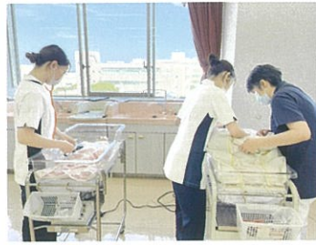
子どもと家族への看護を学ぶ

成長・発達を軸に、一人ひとりの子どもを身体・心理・社会的側面から捉える理論や方法を学び、病気や障害があっても子どもなりの健康が維持・増進される看護について、家族へのケアを含めて学習します。