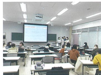
公衆衛生看護学を学ぶ

地域に生活する個人・家族・集団全てを対象とする看護学とその実践を学びます。健康レベルや地域の特性に応じた健康の維持増進、疾病や健康問題の発生予防と回復への支援を行うための理論と方法、保健情報の分析・活用方法を学習します。