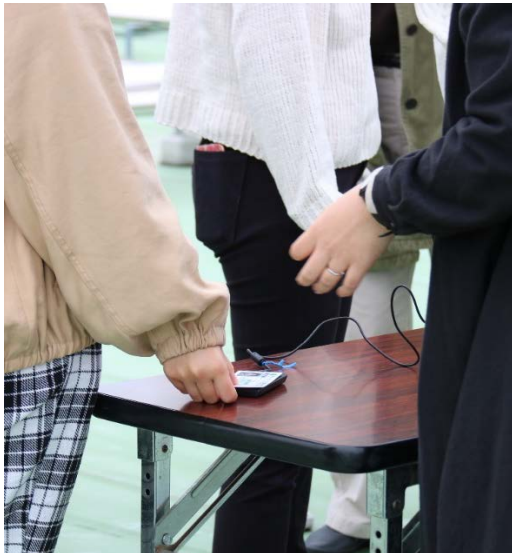
ICカードリーダーで読み込み 建屋ごとの避難状況の整理