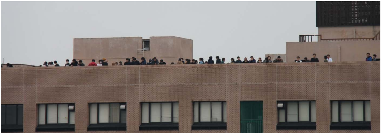
学生と教職員の津波避難計画に基づいた垂直避難

本訓練は、南海トラフ巨大地震と津波警報が発生したという想定で、各部署の津波避難要領の習得、併せて三重大学災対本部と部局の災対本部要員による対策本部業務を行い、津波避難計画の検証を行いました。