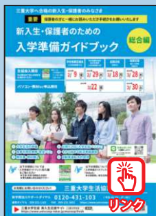
入学準備ガイドブック 総合編