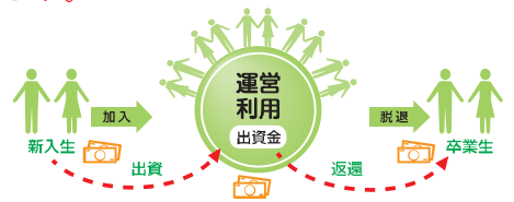
生協は一人ひとりの出資と参加で成り立っています。

大学生協は、三重大大学の学生・教職員が出し合った出資金で運営され、大学生生活全体をさまざまな事業を通じてサポートしていく協同の組織です。大学生協は一人ひとりの出資と参加で成り立っています。三重大学生協は三重大と福利厚生に関する業務委託契約を結んでいます。