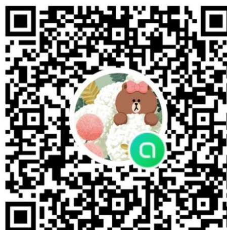
自治会オープンチャット