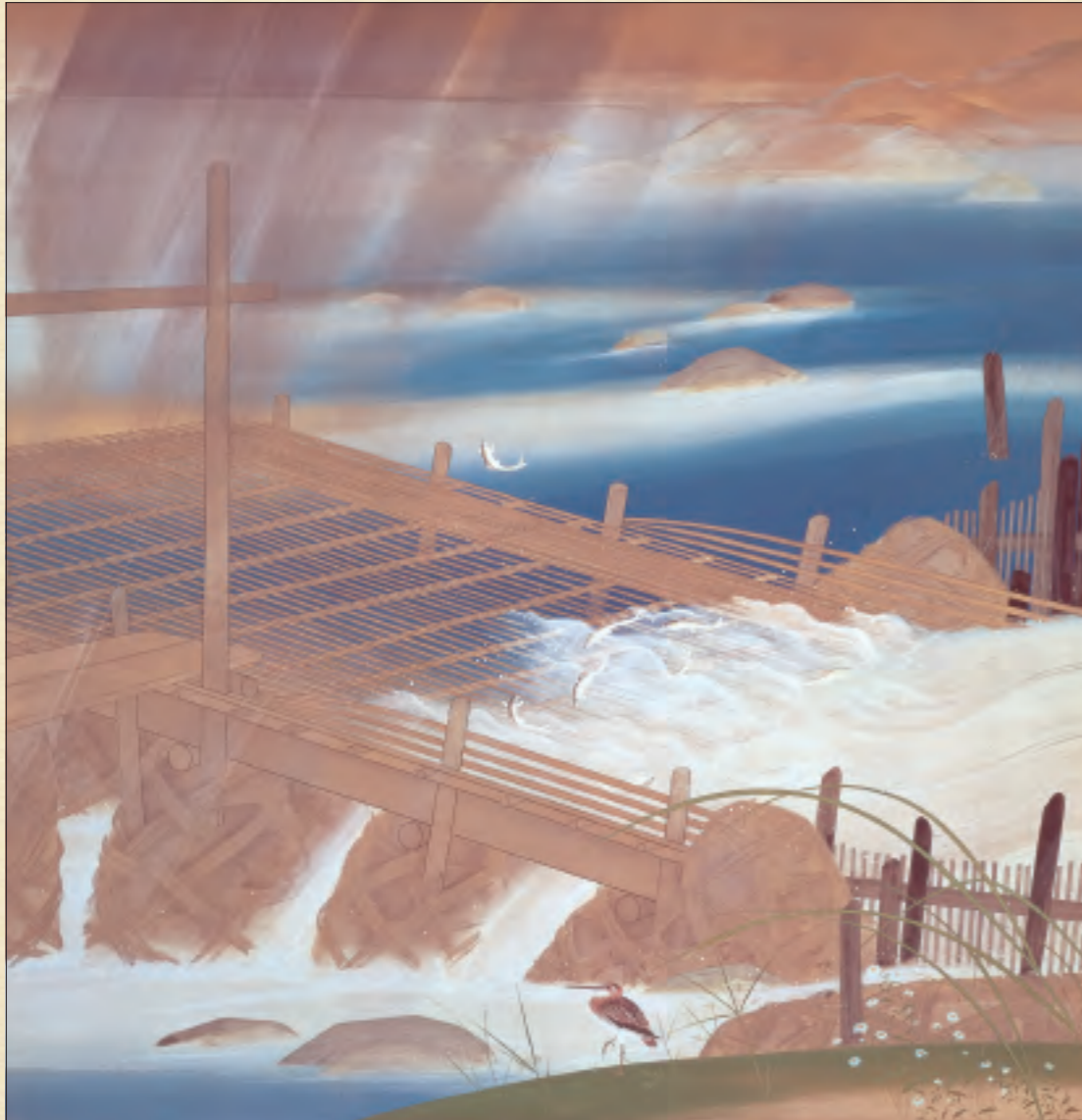
昭和8年(1933) 絹本着色 186.0×180.8cm 松阪市教育委員会蔵