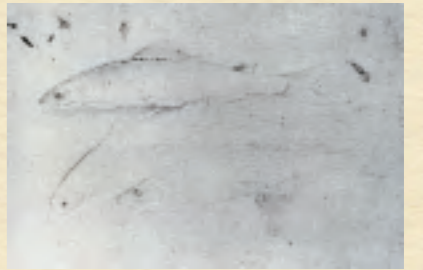
写生帖から。滋賀県野洲川で、鮎の写生に取り組んだ。

荻郎が師を通して学んだ遠祖円山応挙(1733~95)は、「すべては写生からはじまる」と主張し、鳥を望遠鏡で観察したことが知られている。その意味で、「築」は、荻郎が写生を根幹にすえる応挙以来の京都の伝統の正しい継承者であったことをものがたる。