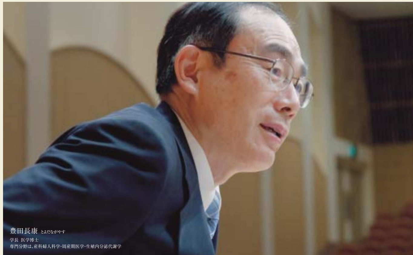
豊田長康 とよだながやす 学長 医学博士 専門分野は、産科婦人科学・周産期医学・生殖内分泌代謝学