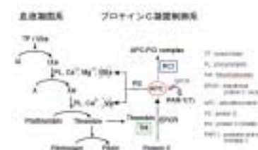
プロテインCによる血液凝固制御機構（図3）