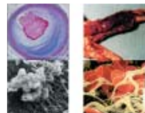
動脈血栓（左）と静脈血栓（右）（図1）

この背景は、人口の高年齢化といわゆる生活習慣病の増大によるものです。加齢に伴い、これまで潜在化していた遺伝的素因が顕在化して血栓症を発症すると考えられています。また、高カロリー・高脂肪食、運動不足などの生活習慣によって、高血圧症、高脂血症、肥満症、糖尿病などに陥り、動脈硬化による動脈血栓症や血液流動性の低下による静脈血栓症を発症しやすくなります（図1）。一旦、血栓症を発症すると患者のQOLの維持は難しく、治療費の高騰は医療経済悪化の最大の原因になっています。