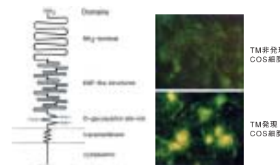
トロンボモジュリン(TM)の機能ドメインおよび組換えTMの発現構造（図5）