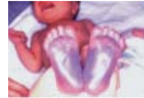
先天性血栓性素因（図2） （プロテインC欠損症の一例： 出生翌日に全身に血栓ができて死に至る）