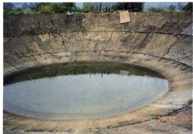
100KW 出力の太陽熱集熱器 製作中(マレーシア・ペルタニアン大学) Solar Heat Collector with 100KW output Constructing(University of Pertanian, Malaysia)

The joint research project between Mie University and UNCRD (United Nations Centre for Regional Development) was launched in July 1993 with the objective of promoting scientific studies of environmental management and regional development in Asian countries. More than 220 researchers are involved in the joint research project: About 110 faculty members of Mie University; 15 staff members of UNCRD; and about 100 researchers of the collaborating universities and institutions in Southeast and East Asian countries, Indonesia, the Philippines, Thailand, Laos, Vietnam, Malaysia, Sri Lanka, India, China, Korea, Gulf countries, Saudi Arabia, Africa (Zaire), and East Europe (The Czech Republic, Poland), and others.