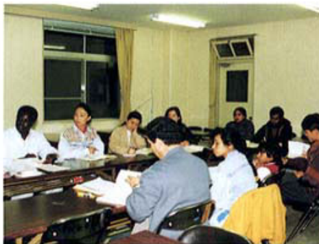
熱心な日本語講座受講者達 Students of the Japanese Course

We hope to accept many international students at Mie University, and at the same time, we think we play an important role for the people in Mie Prefecture.