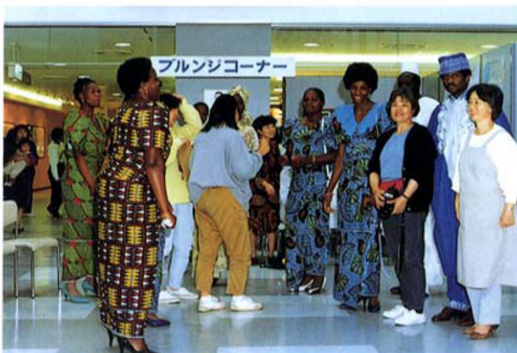
アフリカ留学生家族(奥様)によるファッションショー 豊川市 91,11月

The Japanese Government has set a target of 100,000 foreign students in Japan by the year 2000. This policy is designed to cope with and enhance its international image.