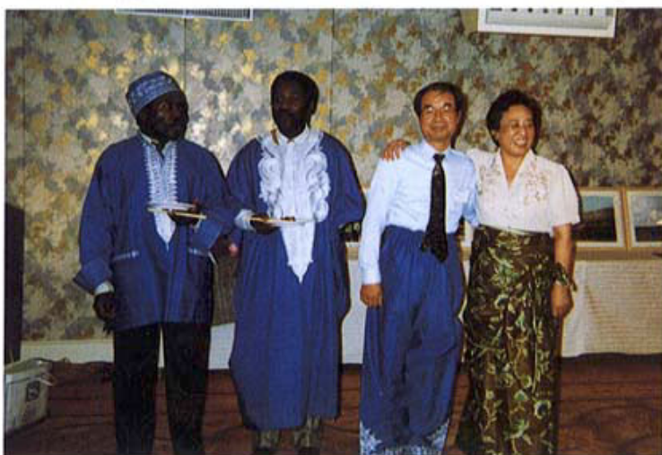
交流パーティ 東京・八王子 91,11

I want to stress here that merely accepting foreign students, or increasing their number, cannot be fruitful without some support for these students. These students need housing, laboratory space, language training, cultural understanding, human contexts for social relationships. With these, foreign students can become actively involved in Japanese soci-