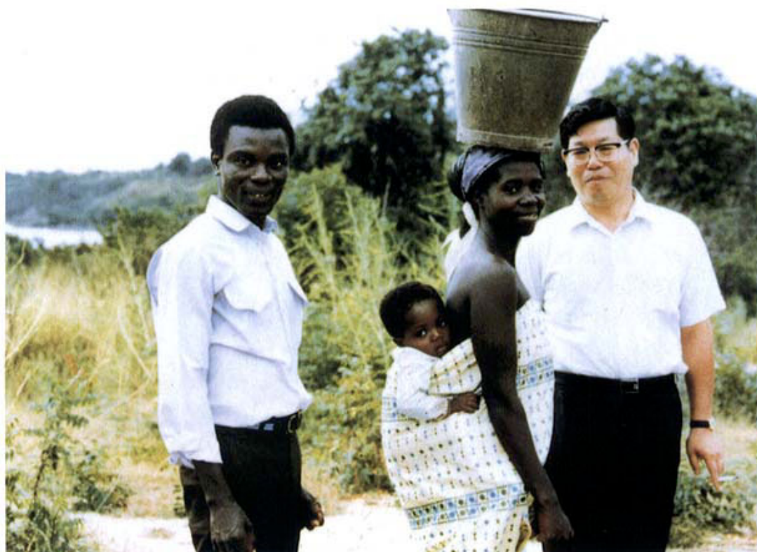
ガーナの人達と筆者（右端） with Ghanaian

The international cooperation activity by the Department of Pediatrics has been going on since 1983. The most active parts are Noguchi Memorial Institute for Medical Research (University of Ghana) and Zambia University Teaching Hospital, both of which belong to the medical cooperation project of the Japan International Cooperation Agency (JICA).