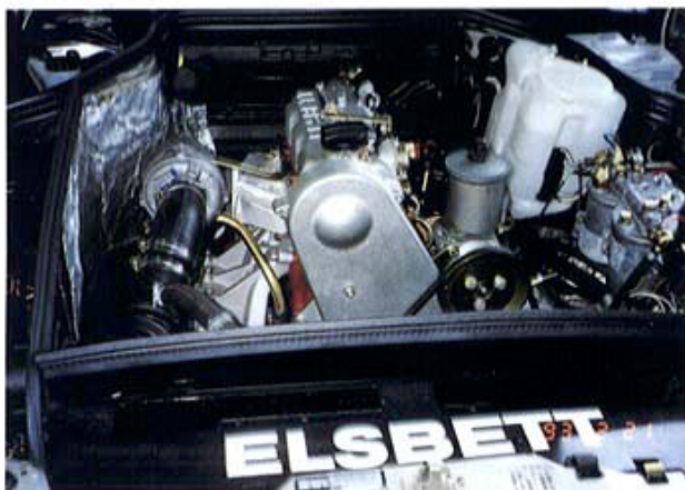
車搭載用パームオイルエンジン 実証走行実験中(マレーシア・ペルトニア大学) Testing Palm Oil Engine applied to Car(University of Pertanian, Malaysia)

以上のごとく、研究テーマは、広範・多岐にわたっている。これらの研究テーマに三重大学が百数十名、UNC RD十数名、調査相手国大学・研究所の研究者、自治体関係者、合計二百数十名が参加する。一大アジア調査研究である。