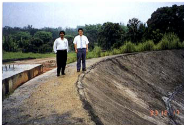
100KW 太陽集熱器のそばで筆者 Solar Heat Collector with 100KW output

All the participants in this Joint-Research project are very active and resourceful. Fruitful results are expected.