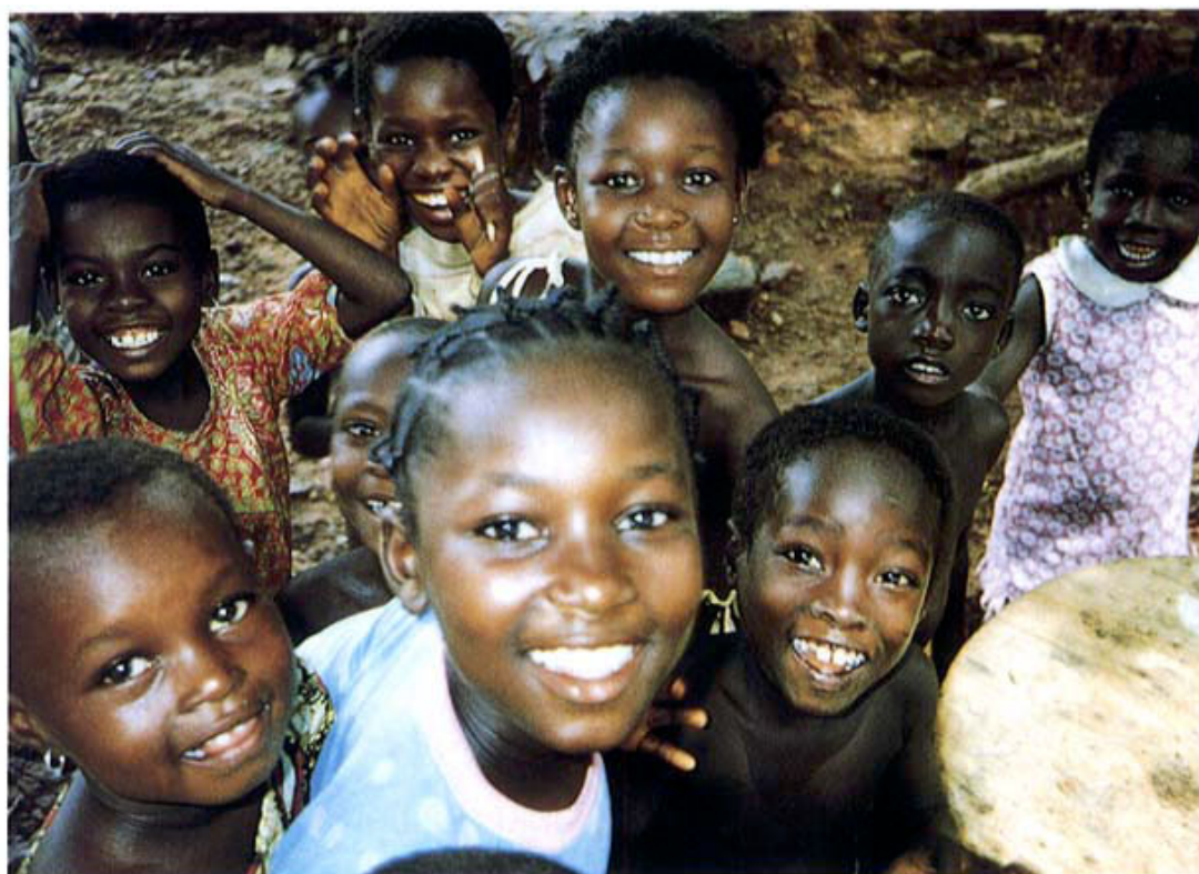
フィールド村の子供達 (ガーナ) Ghanaian Children

Moreover, we joined the Japan Medical Team for Disaster Relief (JMTDR), WHO's Polio Eradica-