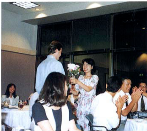
終了式 Awarding of Certificates

1984年夏に始まった夏期研修は、昨年第10回目を迎えました。学生寮の一つに滞在して、アメリカの大学生活を体験しながら、英語とアメリカの文化を勉強します。午前は10名程度の小人数クラスによる英語の授業です。世界的に有名なミシガン・メソッドという教授法が採られています。授業の先生方は、家庭でのディナーに招待する等、家族ぐるみで遇してくれます。午後には、マイノリティーの問題等、アメリカ文化に関するテーマについてミシガン州立大学教授陣による特別講義を聴講します。課外授業として、エジソンやライト兄弟緑の建物等が移築されているグリーンフィールド村と農業機械や自動車の発達の様子を実物で示す他、アポロ宇宙船やケネディが暗殺された時乗っていた自動車まで展示しているヘンリー・フォード博物館を訪ねます。カナダ（ナイアガラの滝、トロント）への小旅行の他、大学近郊の住民の協力でホームステイも体験します。ホストファミリーとは帰国後も手紙のやりとりをする学生も多く、日本で感激の再会をした学生もいます。この研修には本学の学生であれば誰でも参加出来ます。大学院生や医療技術短