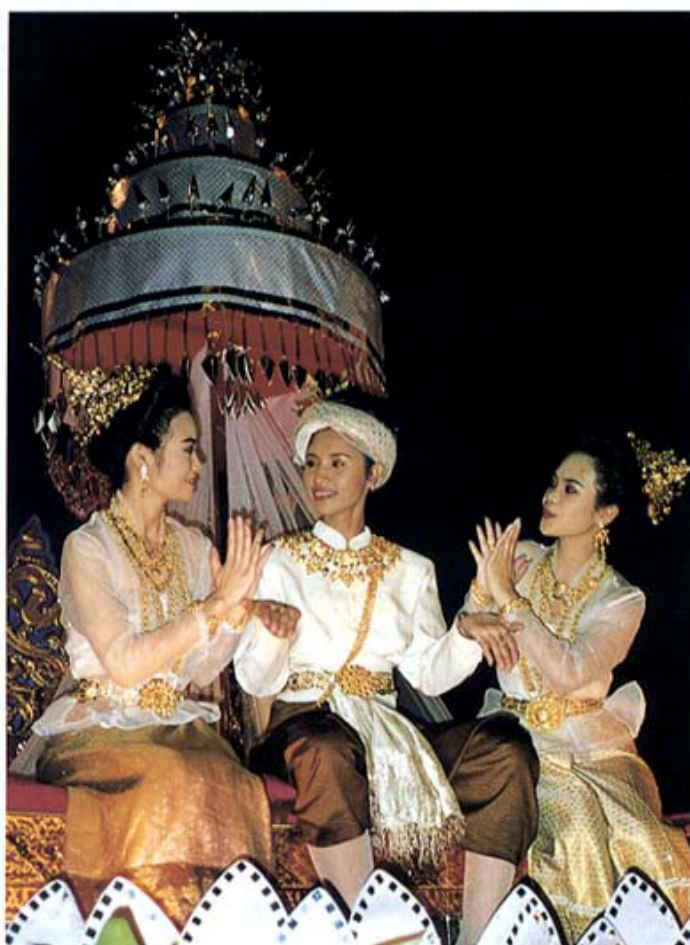
有名な灯籠流し「ロイカトーン」のお祭りのパレードにくり出したチェンマイ大学の山車(1993年11月28日)

Chiang Mai is 700 years old. It was originally a capital of the northern country and still now it has its own culture and warm hospitality, like Nara or Kyoto in Japan. Chiang Mai University has been a sister university of Mie University since August 22,1989.