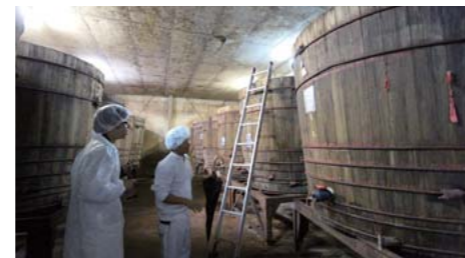
▲巨大な樽の中でしょうゆを熟成させる