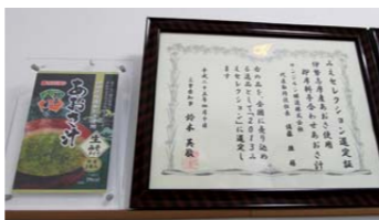
▲「2013みえセレクション」選定証と「あおさ汁」

サンジルスは味だけでなく、地域とのつながりも大切にしてきました。例えば、食育の一環として近隣の小中学校からの社会見学を実施しています。また、地産地消をテーマとして伊勢志摩の特産品、あおさを使ったあおさ汁を商品化し、三重県産の農林水産物等から優れた製品を選定する「2013みえセレクション」に選定されました。他にも、式年遷宮を迎えた伊勢神宮へ伊勢特産あおさ汁を奉納したり、「木曾三川ウルトラマラソン」では協賛企業としてランナーに味噌汁を提供したり、地域住民とのふれあいを積極的に行っています。