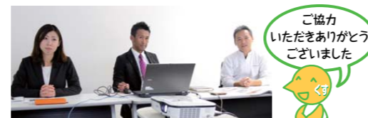
ご協力いただきありがとうございます