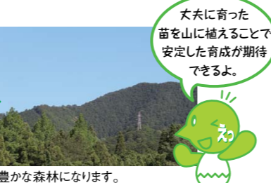
尾鷲ヒノキの苗畑