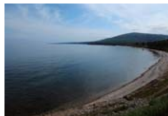
ユニークな生物が生息するバイカル湖。1996年、世界自然遺産に登録

ズドラーストヴィッチェ Здравствуй (Zdravstvuite) ⇒こんにちは スプシーボ спасибо (Spasibo) ⇒ありがとう