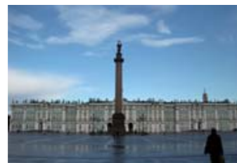
サンクトペテルブルクにあるエルミタージュ美術館。世界三大美術館の一つ