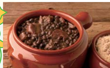
ブラジルの伝統料理「フェジョアーダ」

黒豆や豚肉などを煮込み、塩、コショウ、オレガノ、パセリ、にんにくなどで味付けをするんだよ!