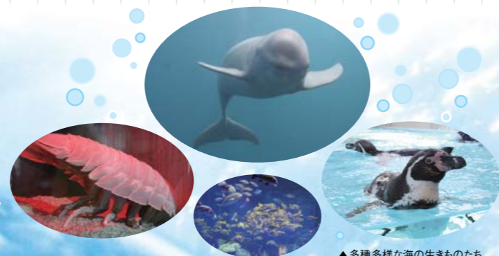
▲多種多様な海の生きものたち