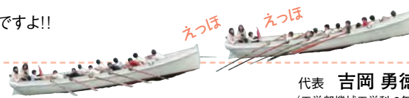
代表 吉岡 勇徳 (工学部機械工学科 3年)

練習場所は津のヨットハーバーです。実際に漕いでみないとカッターの魅力はわかりません!!