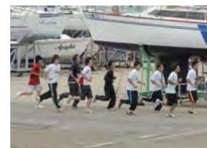
ウォーミングアップも欠かせません!

カッターは珍しいスポーツなので部員はほぼ大学から始めた人ばかりですが、現在部員数は男子16人、女子10人で、大会に向けて楽しく、真剣に取り組んでいます。