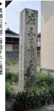
▶黒瀬公民館に移設された道標