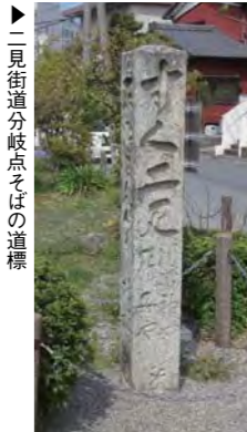
二見街道分岐点そばの道標