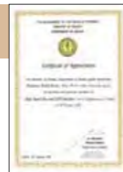
◀ミャンマー保健省にて