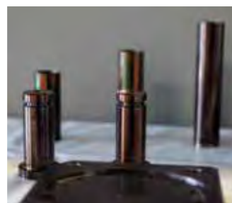
▲コーティングされた部品