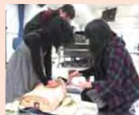
◀人形を使って練習