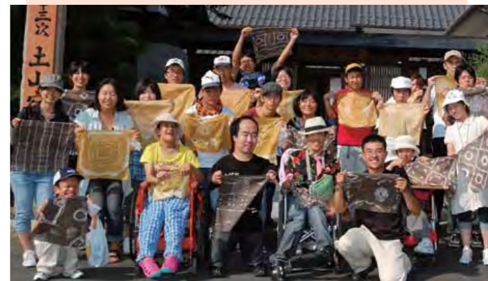
▲土山宿伝馬館(滋賀県)にて

こんにちは、めばえサークルです。私たちは、月に一度、障がいのある人と交流しています。介護、介助を目的としたサークルではなく、自分たちが企画するゲームやイベントを通して、みんなが楽しい時間を過ごせることを目標に活動しています。交流会の内容は、めばえオリジナルゲームをして遊んだり、映画を見に行ったり、クリスマス会を行ったり、様々です。