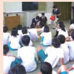
▲津市立南が丘中学校にて