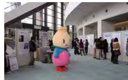
ポスターセッションを見学する“うーまちゃん”

三重大の教育・研究・社会実践の成果を紹介するポスターセッションや「キャリアデザイン2011」と題した講演会が開催されました。