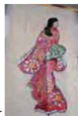
講堂ホワイエにて