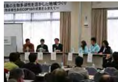
熱心に聴き入る150名の参加者

環境ISO学生委員会を交えて三重の里山・里海の生物多様性を活かした地域づくりについて活発な討論が行われました。