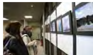
附属図書館 玄関ホールにて

17日～21日 写真部新人展「新人の新人による新人の為の写真展」 訪れた人々は展示作品に見入っていました。